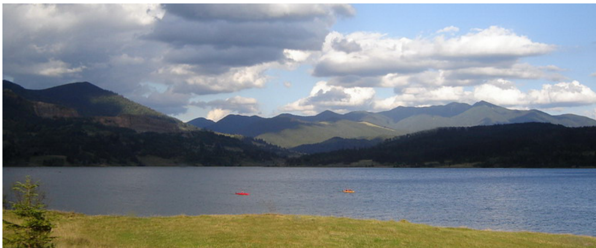
locatii: Raul Bistrita Aurie, Raul Rebra, Raul Bistrita Ardeleana, lacul Colibita.

Va rugam nu ezitati sa ne contactati daca aveti nevoie de orice fel de informatii suplimentare !