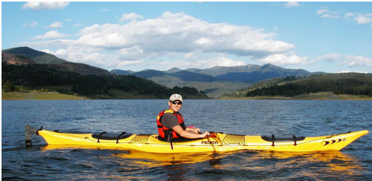
Caiac de mare de tip sit-in pe lacul Colibita